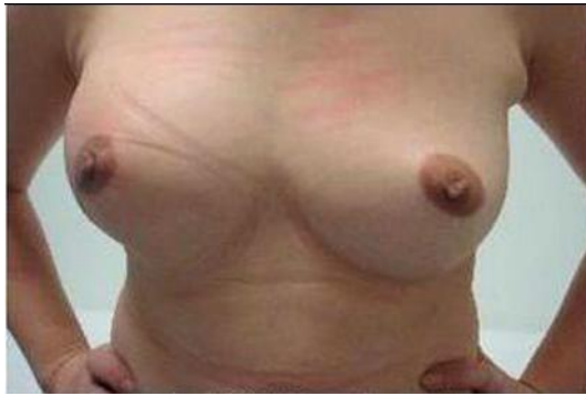
图 7 术后美容效果(正面)