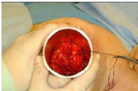
图 3 将肿瘤置于限光筒中心