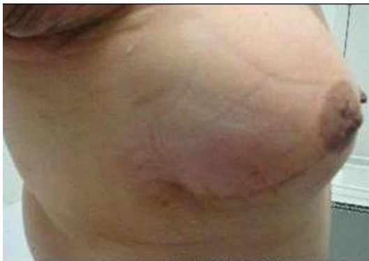
图 8 术后美容效果(侧面)

腺癌试验协作组 (Early Breast Cancer Trialists Collaborative Group EBCTCG) 分析了 1985 年以前开始的全部随机保留乳房手术结合放射治疗的病例, 发现放射治疗可使保留乳房手术后局部复发率下降 67% ( P < 0.01 ), 与乳腺癌相关的死亡率下降 6% ( P = 0.03 ) [9] 。