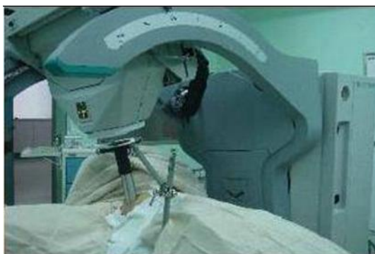
图 5 连接术中放射治疗仪器