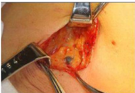
图 2 前哨淋巴结活检