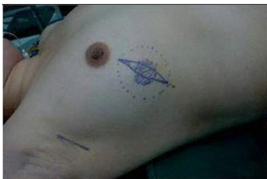
图 1 设计手术切口

组 64例均采用肿瘤局部扩大切除。局部扩大切除应包括距离肿瘤边缘 1~2 cm正常乳腺组织的整块切除。肿瘤切除术后的缺损修复,只在靠近乳头乳晕的部位简单拉拢缝合,以矫正乳头的位置,残腔不置引流,创面喷洒生物蛋白胶起止血和填充残腔的作用,用可吸收线间断缝合皮下组织,Pro lilin线做皮内缝合。术前病理检查未证实者,按肿瘤局部扩大切除原则做“肿瘤活检术”,如术中病理检查证实为恶性则加做腋窝淋巴结清扫手术。对临床不可触及的乳腺肿瘤,在超声或钼靶 X线引导下,应用带倒钩的金属丝穿刺定位后行肿块切除,术中冰冻病理检查,确诊后再行保留乳房手术。本组 64例均做了前哨淋巴结活检(图 2),其中 47例前哨淋巴结活检阴性,17例阳性者(13例术中前哨淋巴结活检阳性+4例术中前哨淋巴结活检阴性但术后石蜡切片阳性)改行部分腋窝淋巴结清扫术。