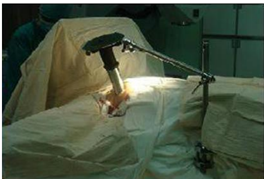
图 4 固定限光筒位置